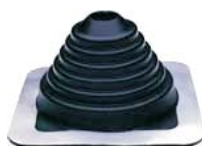
Univerzálna tesniaca manžeta