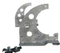
Snehová zábrana držiak guľatiny