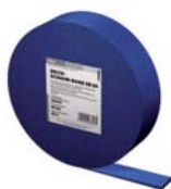
Tesniaca páska pod kontralaty - Delta SB 60 Balenie: 30 m/kotúč