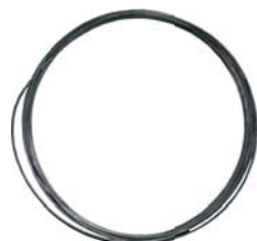
Lano bleskozvodu Materiál: pozinkovaný oceľový drôt