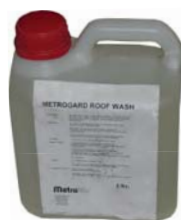
MT MetroGard - koncentrát proti machu a lišajníkom Materiál: kvapalina