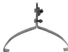
Držiak lana bleskozvodu na oblú hrebenáče Materiál: pozinkovaný oceľový plech