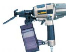
Pneumatický nastreľovač klincov Materiál: plast a oceľ