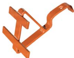
Snehová zábrana dvojkriž Materiál: Pozinkovaný oceľový plech s povrchovou úpravou