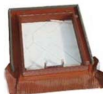
Strešný výlez Materiál: oceľ s povrchovou úpravou, plast