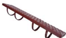
Oblúk strešnej lávky + lávka Material: oceľ s povrchovou úpravou