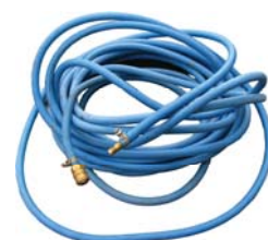
Hadice k pneumat. nastreľov. klincov