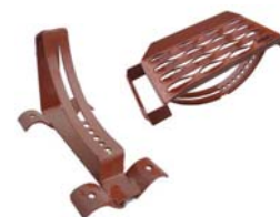
Strešný schod + oblúk Materiál: oceľ s povrchovou úpravou