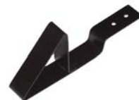
Snehová zábrana nos Materiál: pozinkovaný oceľový plech s povrchovou úpravou